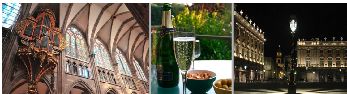
Nef et orgue de la cathédrale de Strasbourg, coupe de champagne, vue de la place Stanislas à Nancy.