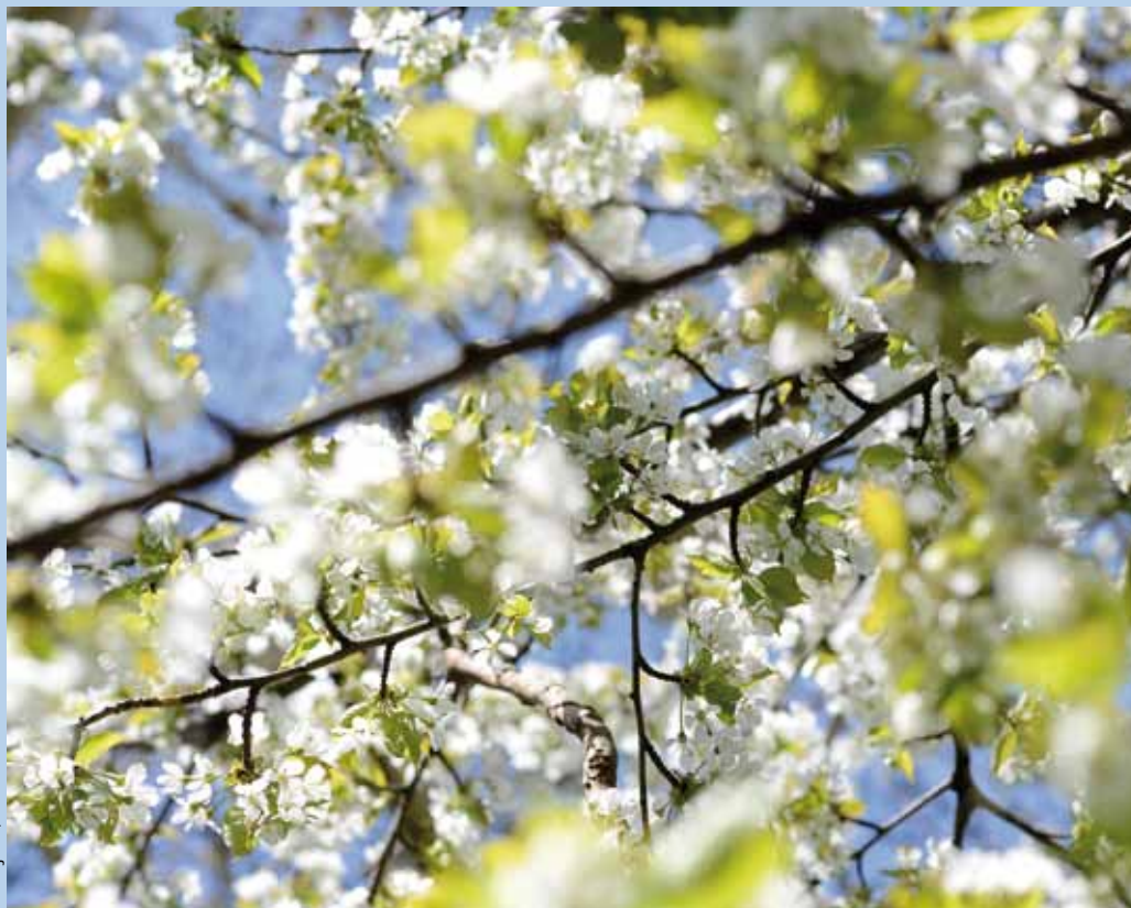
M. Pujatti / Ciric