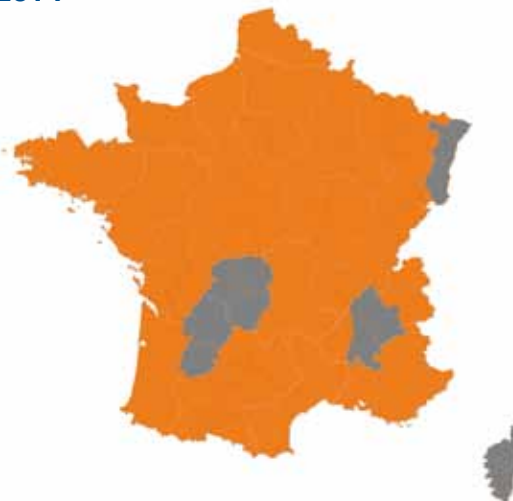
...Dix ans plus tard, Indices est présent sur une majorité de territoires.