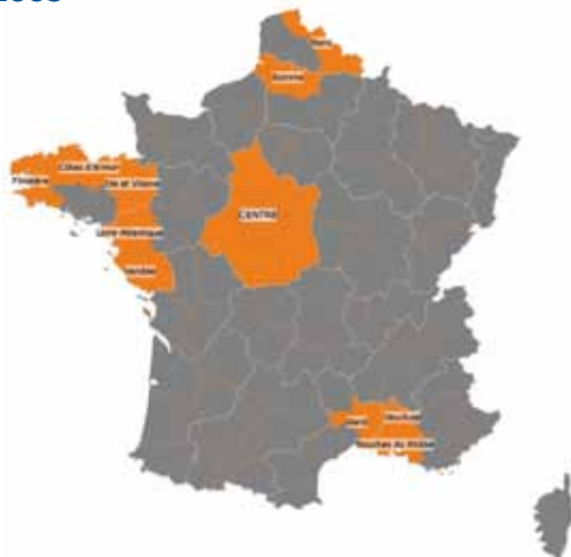
En 2005, une dizaine de territoires « pilotes » participent à la campagne de collecte des données Indices...